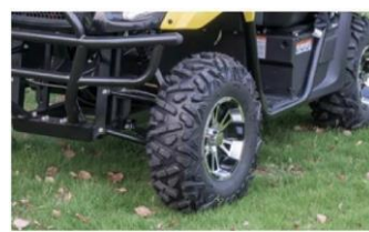
Pneus Todo Terreno