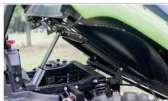
Cilindro de Elevação